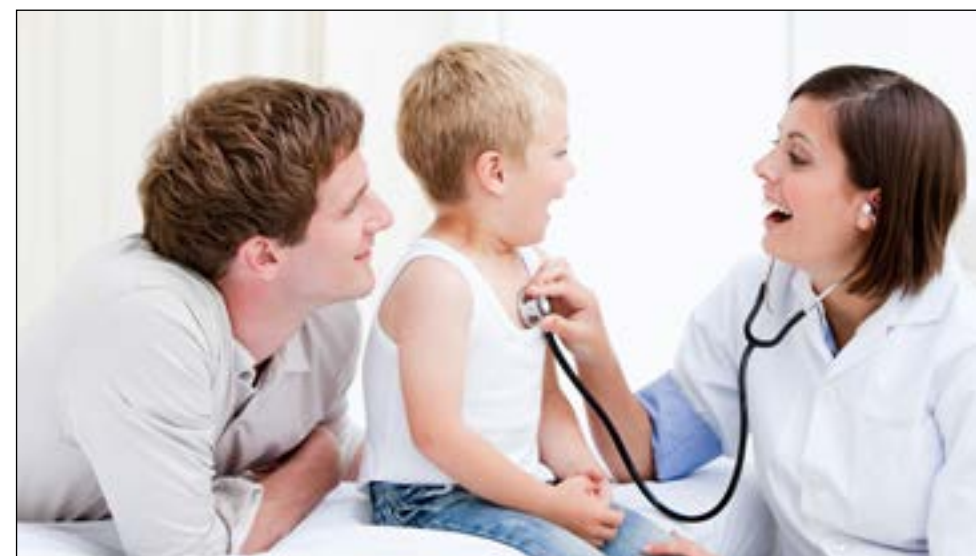
Opplysninger fra foreldre er en viktig kilde til informasjon. (illustrasjonsfoto)

Ukom anbefaler at det gjennom hele akuttkjeden opprettes egne standarder og rutiner for dokumentasjon av foreldres observasjoner og vurderinger av barn.