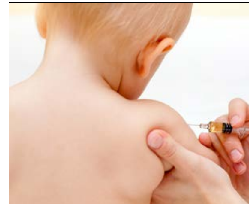
Pneumokokkvaksinen som gis i barnevaksinasjonsprogrammet dekker ikke for alle varianter av bakterien. (illustrasjonsfoto)

Sykdomsbildet ved hjernehinnebetennelse hos barn er sammensatt, og forekomsten har endret seg over tid. Har forståelsen av dette i tilstrekkelig grad nådd helsepersonell som jobber med syke barn?