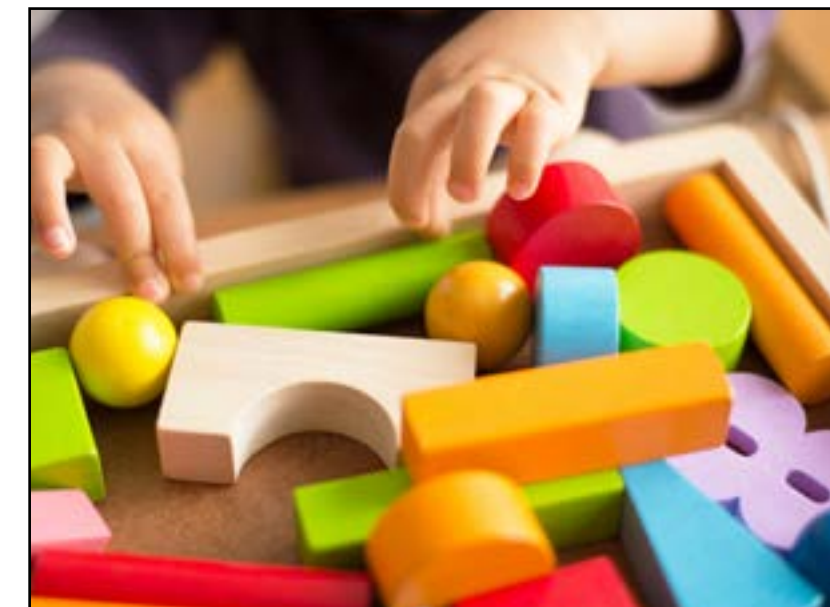
I vurderingen av barns allmentilstand er interessen for lek og omgivelser viktige.